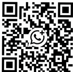
Whatsapp kanaal leidinggevenden