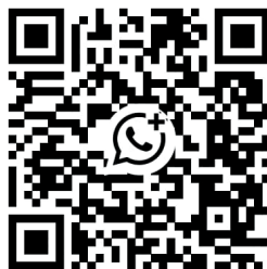
Whatsapp kanaal jongeren